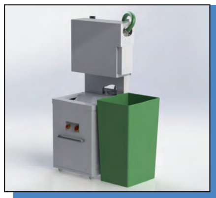
LE TDO 240

C'est un traitement des déchets organiques compact où le déchargement de déchets déshumidifiés se fait directement dans une poubelle standard de 120 ou 240L.